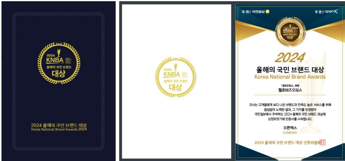
오프라인 상장 및 온라인 인증서

기업 홈페이지에 게재할 수 있는 온라인 인증서와 오프라인 상장과 상패를 제공해드립니다.